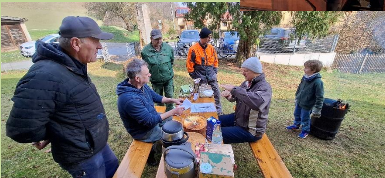
Arbeitseinsatz in Tautenburg (PG)