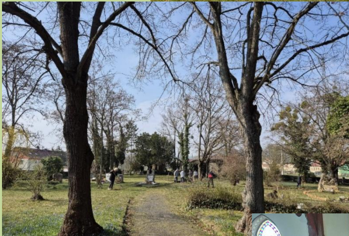
Arbeitseinsatz in Dornburg (< S. 18)